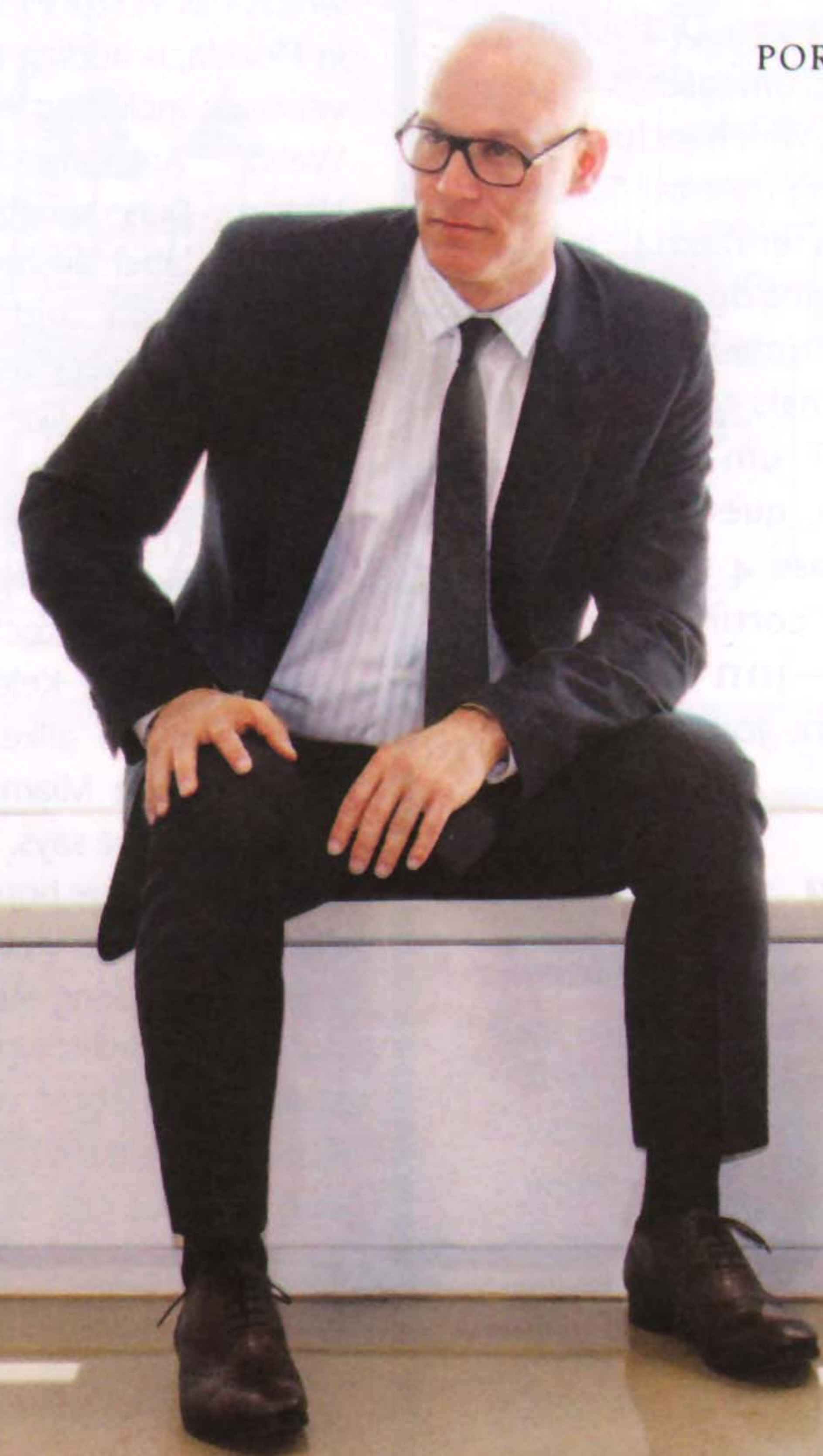
Miami's Design District